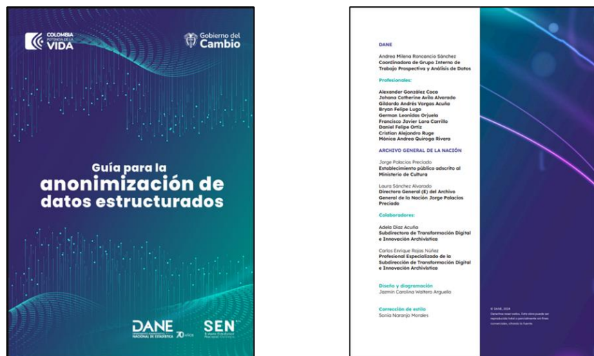
Figura 3. Guía para la Anonimización de datos estructurados

Como resultado, se obtienen productos como bases de datos anonimizadas y documentos metodológicos que describen el proceso, los cuales facilitan la difusión de información en condiciones de seguridad y calidad.