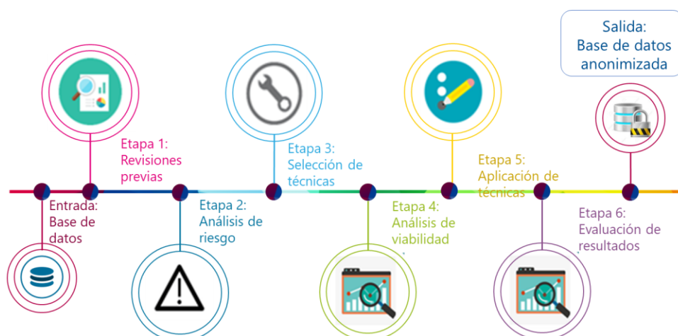
Figura 4. Proceso de anonimización